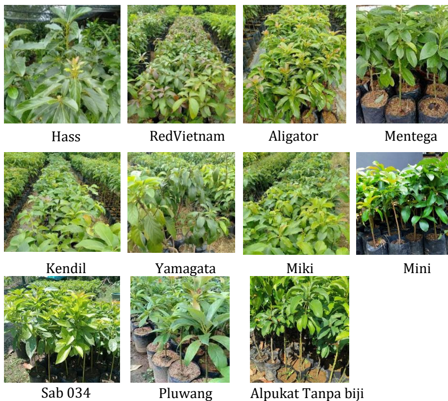
Gambar 2. Varietas bibit Alpukat yang dijual di CV

Bibit alpukat yang dipasarkan di CV Wana Gemilang ada beberapa yang paling sering dicari oleh konsumen yaitu bibit alpukat lokal. Selain jenis bibit alpukat tersebut ada banyak jenis yang lain yaitu bibit alpukat Miki, Red Vietnam, Yamagata, Aligator, dll. Varietas bibit alpukat yang dijual di CV Wana Gemilang disajikan di Gambar 2. Dan Transaksi penjualan Bulan Februari disajikan di Tabel 1.