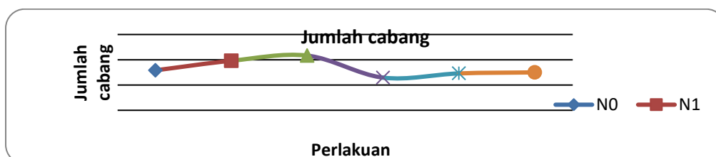
Gambar 2. Rerata jumlah cabang produktif pada kedelai yang dihitung pada saat pengambilan sampel atau panen

berat polong isi diperoleh bahwa perlakuan N5 memperlihatkan hasil tertinggi (131,67g) dibandingkan dengan perlakuan lainnya. Hal ini disebabkan perlakuan N5 merupakan kombinasi pemupukan terpadu antara pupuk anorganik dan asam humat yang terkandung pada pupuk anorganik tersebut. Pemupukan terpadu antara pupuk organik dan anorganik berpengaruh juga pada peningkatan hasil seperti pada perlakuan N3 yang terlihat pada gambar 3.