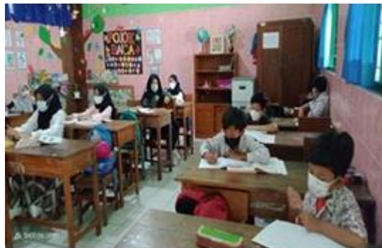
Gambar 1. Suasana Pembelajaran di Kelas V yang Terlihat Pasif

Kesulitan belajar siswa dapat dihilangkan dengan adanyan motivasi yang diberikan kepada anak, motivasi baik dalam bentuk kata ataupun tindakan sangatlah dibutuhkan bagi anak teruntuk siswa SD yang masih dalam proses perkembangan dini sehingga membuat guru SD harus dapat memahami karakteristik siswa, apa yang dibutuhkan oleh siswa dengan begitu dapat membantu kesulitan yang dihadapi siswa di Dalam Kelas Tingkat literasi peserta dapat di kategorikan menjadi 3 yaitu, ada literasi tingkat rendah yang artinya peserta belum memiliki pemahaman terkait numerasi matematika dan harus diberi pendampingan dalam memberikan pemahaman numerasi serta diberi motivasi lebih untuk membangkitkan semangat anak, kemudian literasi tingkat sedang dimana anak secara perlahan telah memahami literasi numerasi matematika dan tetap diberikan bimbingan dan motivasi sehingga dapat lebih ditingkatkan lagi yang nantinya membuat anak akan jauh lebih aktif di dalam kelas dan yang terakhir literasi tingkat tinggi dimana peserta didik dapat mengetahui numerasi dengan sangat baik namun anak tetap harus diberi bimbingan serta motivasi agar lebih semangat untuk belajar dan aktif dalam pembelajaran.