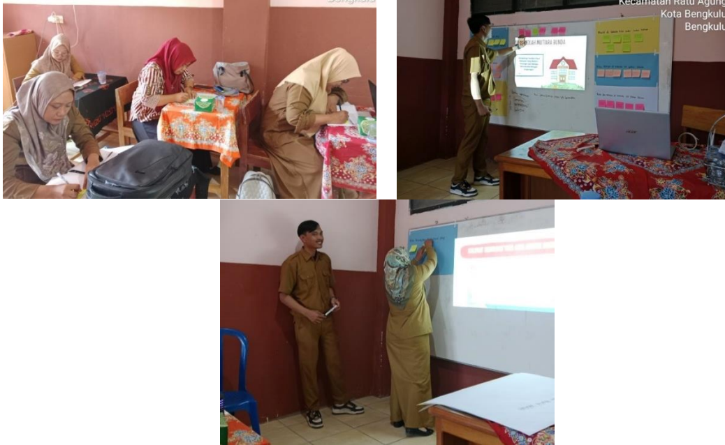
Gambar 2. Kegiatan Calon Guru Penggerak, Pemaparan Prakarsa Perubahan, dan Penyampaian Pendapat