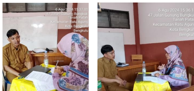
Gambar 1. Pendampingan Individu dan Penguatan Kepada CGP

Hasil pendampingan individu menunjukkan bahwa pendekatan mentoring dan coaching sangat efektif dalam meningkatkan kompetensi pedagogik calon Guru Penggerak. Dukungan yang diberikan secara personal memungkinkan calon guru untuk mengatasi tantangan spesifik yang mereka hadapi di kelas. Lebih lanjut, kegiatan refleksi yang terstruktur membantu calon guru untuk mengembangkan kemampuan evaluasi diri dan menjadi lebih peka terhadap kebutuhan siswa. Temuan ini sejalan dengan (Syarifuddin & Adiansha, 2023) yang menyatakan bahwa pendampingan individu dapat mempercepat proses pembelajaran profesional guru.