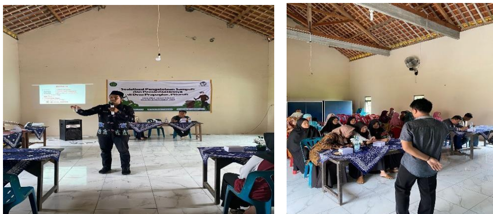
Gambar 2. Pelaksanaan Kegiatan Edukasi Bank Sampah

Kegiatan ini dilaksanakan pada hari jumat 27 Januari 2023 di Aula Balai Desa Prapag Lor. Kegiatan ini merupakan kegiatan pertama kami sebagai bentuk pengenalan terhadap masyarakat agar masyarakat dapat mendapatkan ilmu yang bermanfaat yang di sampaikan oleh narasumber. Pelatihan ini dihadiri oleh petugas bank sampah dan pengelola bank sampah Sido Maju, pemerintah setempat, mahasiswa KKN UMPurworejo, dan Dosen Pembimbing Lapangan. Peserta yang hadir di sosialisasi dan seminar ini adalah beberapa dusun di Desa Prapag Lor, yaitu Dusun Kabekelan, Dusun Pecitran, Dusun Krajan, Dusun Klimparaan, Dusun Bojongan Kidul, dan Dusun Bojongan Lor.