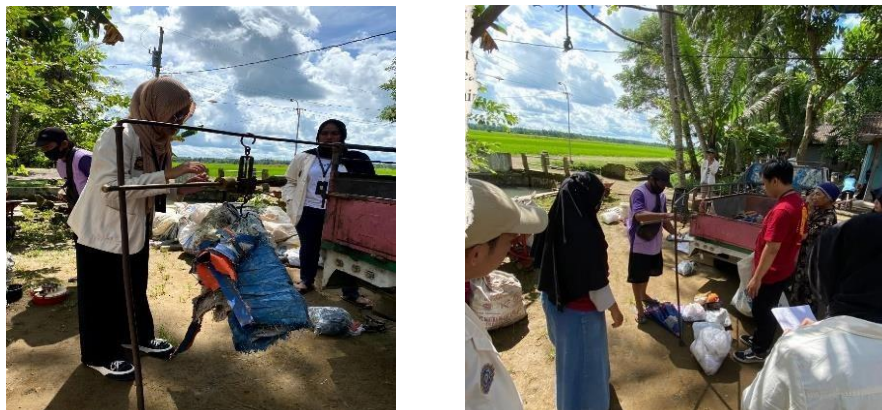
Gambar 1. Observasi Bank Sampah Sido Maju