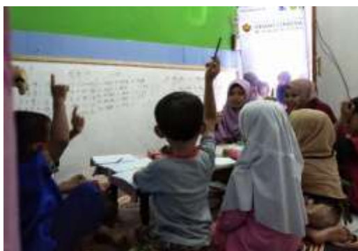
Gambar 3. Bimbingan Belajar

Oemah Cendekia juga memberikan bimbingan belajar pada warga masyarakat terutama siswa-siswa usia sekolah, yang menjadi salah satu program kegiatan yang dilaksanakan oleh anggota Tim Oemah Cendekia. Gambar 2 menunjukkan proses bimbingan belajar mata pelajaran matematika yang diikuti oleh anak-anak dengan sangat antusias.