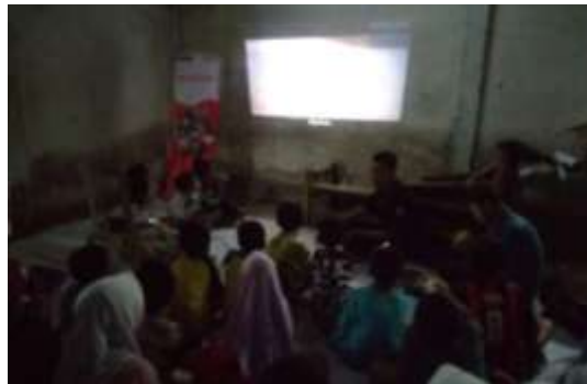
Gambar 5. Kegiatan pemutaran film edukasi

Tujuan utamanya adalah untuk membuat anak-anak termotivasi kepada film-film edukasi yang baik untuk ditonton dan dapat diambil pelajarannya agar mereka terbiasa untuk menonton film yang menyerupai film tersebut serta menarik minat anak-anak terhadap budaya baca.