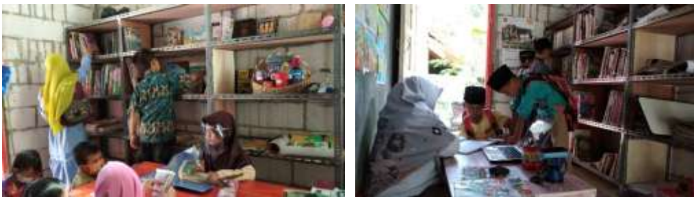
Gambar 2. Induk Serambi Baca Cendekia

Serambi baca Cendekia merupakan program pojok baca yang dirancang sebagai tempat untuk membaca buku yang sasarannya adalah seluruh lapisan masyarakat, generasi muda, orangtua, maupun anak-anak. Kegiatan di induk serambi baca cendekia dapat ditunjukkan pada Gambar 2 .