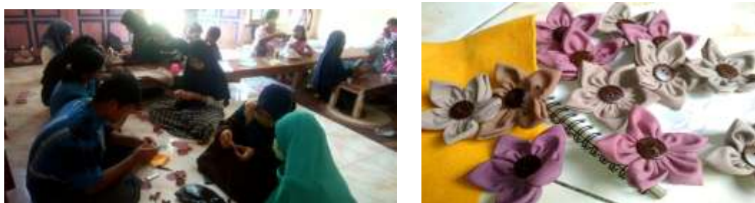
Gambar 6. Proses pembuatan bross

Selain kegiatan edukasi, Oemah Cendekia juga berupaya untuk meningkatkan perekonomian dari kegiatan yang dilakukan, salah satunya dengan membuat kreasi-kreasi dari bahan-bahan ramah lingkungan. Kegiatan ekonomi kreatif ini salah satunya dengan membuat pernak-pernik atau asesoris berupa bros untuk penghias kerudung dan sebagainya. Pembuatan pernak-pernik ini diinisiasi oleh penggiat Oemah Cendekia dan dilaksanakan dengan baik oleh peserta. Proses pembuatan dan produk bross dapat ditunjukkan pada Gambar 7 .