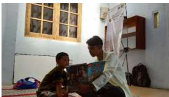
Gambar 4. Storytelling

Kegiatan ini merupakan cara yang paling utama dalam menumbuhkan serta meningkatkan minat baca anak. Hal ini disebabkan oleh saat mereka menyaksikan pertunjukan storytelling , motivasi mereka untuk membaca akan muncul dan bertambah. Menurut Ayuni, R. D., Siswati, S., & Rusmawati, D. (2013) storytelling merupakan sebuah seni bercerita yang dapat digunakan sebagai sarana untuk menanamkan nilai-nilai pada anak yang dilakukan tanpa perlu menggurui sang anak dan cara yang efektif untuk mengembangkan aspek pengetahuan, aspek perasaan, sosial, dan aspek penghayatan anak-anak. Kegiatan storytelling pada Oemah Cendekia dapat ditunjukkan pada Gambar 4.