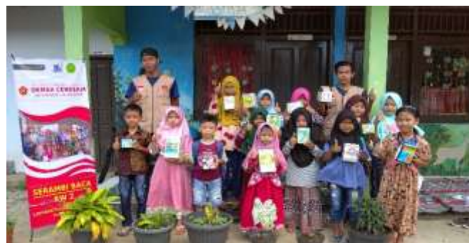
Gambar 6. Kreasi anak membuat celengan dari kardus bekas

Kreasi anak merupakan kegiatan untuk mengajak anak-anak berkreasi, tujuan diadakannya kegiatan ini pertama, dengan berkreasi anak dapat mewujudkan dirinya. Perwujudan diri merupakan salah satu kebutuhan manusia. Kedua, dengan anak selalu berpikir kreatif memungkinkan anak untuk menyelesaikan suatu masalah. Serta anak dapat mengekspresikan pikirannya tanpa ada batasan. Serta dapat melahirkan suatu gagasan baru. Ketiga, dengan menyibukkan diri secara kreatif akan memberikan kepuasan kepada anak. Hal ini karena tingkat kepuasan anak mempengaruhi perkembangan sosial emosional anak. Keempat, dengan kreativitas memungkinkan manusia untuk meningkatkan kualitas dirinya. Beberapa kegiatan yang sudah dilakukan diantaranya kreasi membuat makanan, kreasi menghias sandal dari bahan flannel, kreasi membuat celengan dari kardus bekas, dan kreasi membuat hiasan dinding. Kegiatan kreasi anak ini dapat disajikan pada Gambar 6 .