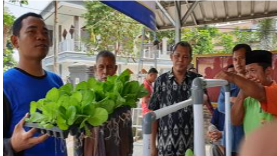
Gambar 3. Praktik Memindahkan Benih Ke Media Tanam Hidroponik

Langkah pertama menyiapkan wadah tanam kemudian isi bagian media tanam dengan larutan nutrisi. Langkah selanjutnya memindahkan benih yang beisi tanaman yang sudah berdaun empat ke bagian paralon yang sudah disiapkan sebagai wadah tanam bibit sayuran dengan sistem hidroponik ( Gambar 3 ).