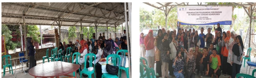
Gambar 1. Penyuluhan tentang Hidroponik oleh Tim Abdimas Universitas Terbuka

Berdasarkan hasil pre-test dan post-test pada Tabel 1 diketahui terjadi peningkatan pengetahuan warga tentang budidaya tanaman sayuran dengan sistem hidroponik dari 65,38% menjadi 100%. Pemahaman warga tentang Hidroponik merupakan budidaya tanaman menggunakan media air sebelum penyuluhan disampaikan oleh 94,12% selebihnya warga mempunyai pemahaman bahwa hidroponik merupakan budidaya tanaman menggunakan media tanah dan sekam/sabut kelapa. Setelah penyuluhan dan praktik pemahaman warga 100% memahami bahwa hidroponik merupakan budidaya tanaman menggunakan media air. Sumber pengetahuan warga sebelum penyuluhan diperoleh dari instansi pendidikan dan penyuluhan dinyatakan oleh 70,58% dan 29,42% dari media massa berupa koran, majalah atau TV. Sebanyak 76,47% warga mengetahui ada tetangga sekitar yang sudah menanam sayur dan buah dengan sistem hidroponik. Dapat disimpulkan setelah kegiatan abdimas warga mengetahui bahwa hidroponik adalah bercocok tanam dengan menggunakan media air yang telah diberi nutrisi untuk mendukung perkembangan tanaman yang akan diserap oleh akar.