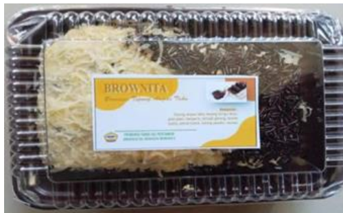
Gambar 4. Brownita (Brownis Ampas Tahu)

Ampas tahu merupakan salah satu limbah padat dari industri tahu yang sampai saat ini kurang pemanfaatannya. Padahal kandungan protein dan serat masih banyak didalam ampas tahu itu. Selama ini pengusaha tahu ataupun masyarakat memanfaatkannya sebagai pakan ternak, pembuatan oncom, ataupun tempe gembus. Oleh karena itu dibutuhkan inovasi dan kreativitas untuk menciptakan sebuah produk yang memiliki nilai ekonomis, yang bisa membantu meningkatkan kesejahteraan finansial keluarga seperti brownies. Brownies ampas tahu (Brownita) dapat dilihat pada Gambar 4.