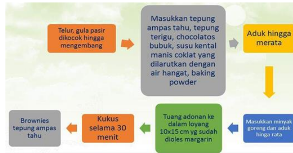
Gambar 5. Proses Pengolahan (Brownies Ampas Tahu)