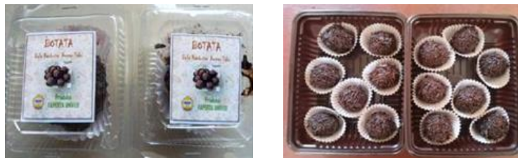
Gambar 6. Botata (Bola Bola Rambutan Ampas Tahu)

Selain Brownita, pemanfaatan tepung ampas tahu dapat diolah menjadi botata atau bola-bola rambutan ampas tahu. Pengolahan tepung ampas tahu menjadi botata bertujuan untuk menurunkan tingkat pencemaran industri pengolahan tahu dan meningkatkan nilai ekonomi produk olahan pangan berbasis limbah ampas tahu. Sehingga dengan pengolahan tersebut dapat meningkatkan penghasilan warga setempat terutama para pelaku usaha tahu di desa Bukit Peninjauan 1, kecamatan Sukaraja, kabupaten Seluma. Produk bola-bola rambutan ampas tahu (botata) dapat dilihat pada Gambar 6.