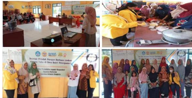
Gambar 8. Kegiatan Sosialisasi dan Pengabdian

Pada kegiatan penyuluhan dan sosialisasi ini, tim pengabdian menjelaskan pentingnya pengemasan untuk meningkatkan kualitas produk brownies yang dibuat (Gambar 8). Yuyun & Gunarsa (2011) mengemukakan bahwa nilai lebih suatu produk meningkat dengan melakukan pengemasan yang tepat dan menarik. Jenis kemasan yang disosialisasikan pada kegiatan ini adalah kemasan plastik mika.