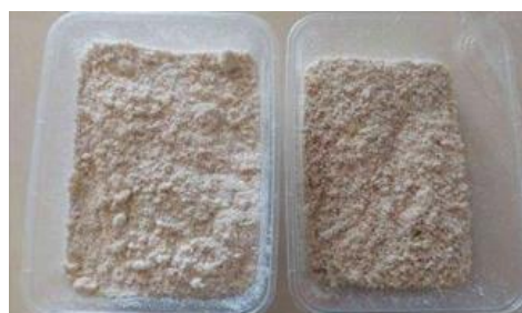
Gambar 2. Tepung Ampas Tahu

Ampas tahu segar mengandung air yang cukup tinggi, jika disimpan begitu saja akan menyebabkan tumbuhnya mikroorganisme seperti jamur dan mudah terjadi pembusukan. Sehingga upaya untuk memperpanjang umur simpannya dapat dilakukan dengan mengurangi kadar air yaitu diolah menjadi tepung. Tepung ampas tahu mengandung 66,24% karbohidrat, 17,72% protein, 2,62% lemak, dan 3,23% serat kasar. Sama seperti tepung pada umumnya, tepung ampas tahu dapat diolah kembali menjadi berbagai macam olahan turunannya sehingga memperkaya varian olahan ampas tahu. Selain itu, pengolahan tepung ampas tahu dapat memperpanjang umur simpan dan memudahkan dalam pemanfaatannya (Andayani et al. , 2022). Tepung ampas tahu dapat dilihat pada Gambar 2.