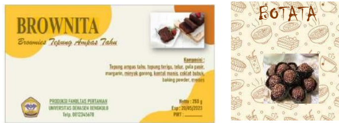
Gambar 7. Desain Kemasan Brownita dan Botata