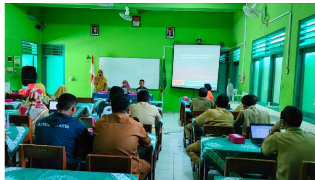
Gambar 1. Seminar Sosialisasi Tentang Literasi Digital Bagi Guru

Kegiatan pengabdian selanjutnya yaitu dilanjutkan dengan pendampingan tentang aplikasi digital di sekolah. Sebagai narasumber utama, Arie Puwanto, S.Pd., M.Sc. (ketua pengabdi), memaparkan beberapa hasil penelitian terkait literasi digital di sekolah. Selain itu, materi juga dilanjutkan dengan pendampingan kegiatan kepada guru-guru berupa aplikasi literasi digital. Aplikasi yang dimaksud misalnya berupa aplikasi perpustakaan digital dan sistem pembayaran digital di sekolah. Kegiatan ini juga turut dibantu oleh mahasiswa yang membantu pelaksanaan teknis kegiatan di lapangan. Dokumentasi pelaksanaan kegiatan pengabdian ditunjukkan pada Gambar 1 dan Gambar 2 .