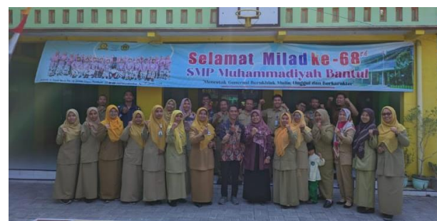
Gambar 2. Peserta Kegiatan Pengabdian (Guru dan Narasumber)

Kegiatan pengabdian diakhiri dengan pengisian kuisioner oleh peserta kegiatan. Tim Pengabdi menyiapkan sejumlah pernyataan terkait kegiatan pengabdian yang telah dilakukan. Hal ini dijadikan sebagai instrumen mengukur tingkat keberdayaan mitra. Keberdayaan mitra yang dimaksud dalam pengabdian ini yaitu peningkatan pengetahuan dan keterampilan mitra kegiatan pengabdian terkait literasi digital.