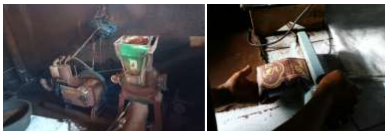
Gambar 2. Kondisi Mesin Penggiling dan Sealer Waktu Survei Lanjutan

Pada tahap awal pelaksanaan kegiatan PKM pada Kopi Lelet Cap Cangkir dan Kopi Lelet Cap Leo, tim telah melakukan koordinasi untuk menggali lebih lanjut kebutuhan yang mendesak untuk difasilitasi oleh tim sebagaimana yang telah disepakati bersama waktu survei awal. Selain itu, tim juga memberikan masukan kepada UMKM Kopi Lelet atas permasalahan yang dihadapi, terutama tentang kemasan produk dan diversifikasi produk. Koordinasi yang dilakukan tim dengan UMKM Kopi Lelet Cap Cangkir dan Cap Leo berjalan dengan lancar dan bersifat kekeluargaan. Survei lanjutan dan koordinasi tim dengan UMKM mitra dimaksudkan untuk mencari solusi permasalahan UMKM mitra yang segera difasilitasi. Pada saat survei lanjutan dan koordinasi sebagaimana dapat dilihat pada Gambar 2 di bawah, tim menemukan mesin penggiling kopi yang sudah tidak layak digunakan lagi, informasi yang diperoleh dari UMKM mitra sering rusak dan bila dilihat tangki solar sudah terpisah dengan mesinnya, hal tersebut bisa berbahaya bagi pekerja.