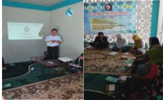
Gambar 7. Kegiatan Pelatihan Kewirausahaan dan Manajemen UMKM

serta laba sesungguhnya dari usahanya. Sehingga UMKM Kopi Lelet Cap Cangkir dan Cap Leo bisa merencanakan untuk pengembangan usahanya dari kondisi keuangan yang dimiliki.