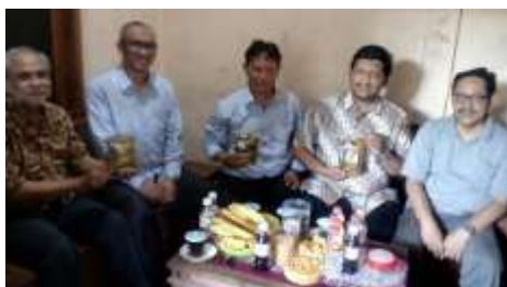
Gambar 3. Koordinasi Tim dengan UMKM Mitra

Adapun kegiatan koordinasi tim dengan UMKM mitra dapat dilihat pada Gambar 3 di bawah.