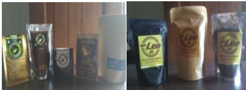
Gambar 6. Desain Kemasan Setelah Pendampingan

Untuk meningkatkan kemampuan berwirausaha dan manajerial UMKM Kopi Lelet Cap Cangkir dan Cap Leo, maka tim melakukan kegiatan pelatihan kewirausahaan dan manajemen, dengan materi tentang kewirausahaan, manajemen keuangan dan manajemen pemasaran. Pelatihan kewirausahaan dan manajemen dilaksanakan adalah untuk meningkatkan pengetahuan dan kemampuan UMKM mitra dalam mengelola usaha sehingga bisa lebih berkembang dan maju. Salah satu kelemahan UMKM adalah masih belum tertibnya administrasi pencatatan transaksi usaha, atau dengan kata lain biasanya UMKM belum memiliki pencatatan laporan keuangan yang baik, dimana belum dipisahkannya kepemilikan dan pengelolaan perusahaan dengan keluarga.