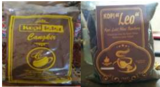
Gambar 5. Desain Kemasan Sebelum Pendampingan