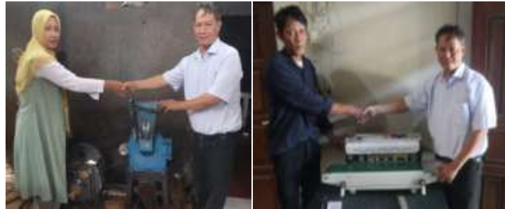
Gambar 4. Serah Terima Mesin

Penyediaan fasilitas mesin penggiling kopi dan mesin sealer dianggap urgen, karena untuk meningkatkan produktivitas produk Kopi Lelet Cap cangkir dan Cap Leo. Produktivitas merupakan penciptaan kekayaan melalui hasil karya penerapan pengetahuan sehingga dapat disediakan produk-produk serta jasa-jasa yang memenuhi kebutuhan para pemakai dan bersifat konsisten dengan tujuan sosial, lingkungan dan ekonomi masyarakat (Monga dalam Mandala dan Raharja, 2012). Produktivitas menurut Kusmindari dan Apriyanto (2009) berkaitan dengan efisiensi dan efektivitas. Efisiensi merupakan suatu ukuran yang menjelaskan tingkat penghematan dalam penggunaan sumber daya, dalam hal ini efisiensi lebih berorientasi pada masukan daripada keluaran. Efektivitas adalah suatu ukuran yang menjelaskan seberapa jauh target dapat dicapai, dalam hal ini efektivitas lebih berorientasi pada keluaran daripada masukan. Sehingga berdasarkan definisi tersebut, dapat dikatakan bahwa peningkatan produktivitas UMKM Kopi Lelet dengan menggunakan mesin penggiling kopi dan sealer diharapkan sangat tepat karena dalam memproduksi UMKM Kopi Lelet Cap Cangkir dan Cap Leo bisa lebih efisien dan efektif guna mencapai tujuan sosial, lingkungan dan ekonomi UMKM.