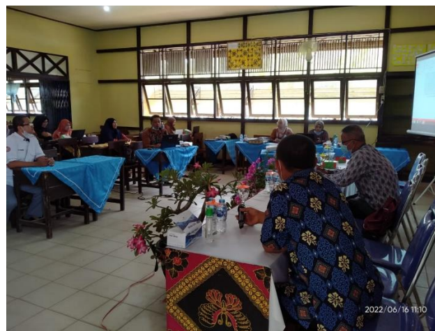
Gambar 2. Kegiatan Review Artikel

Pada tahap kedua dilakukan review artikel yang telah dibuat sebelumnya oleh peserta. Dalam kegiatan ini terdapat tiga artikel guru yang telah disiapkan. Salah satu artikel peserta yang diriview berkaitan dengan penerapan model pembelajaran yang digunakan dalam mata pelajaran matematika. Dari artikel yang telah disajikan diberikan beberapa masukan yaitu terkait tata cara penulisan, pemberian judul artikel, penyusunan latar belakang, metodologi, dan referensi. Melalui review artikel yang dilakukan secara langsung terhadap artikel yang telah dibuat, peserta diberikan pengalaman yang aplikatif, dan dapat memotivasi diri sendiri serta lainnya dalam menulis artikel. Dokumentasi pada tahap kedua dapat dilihat pada Gambar 2 .