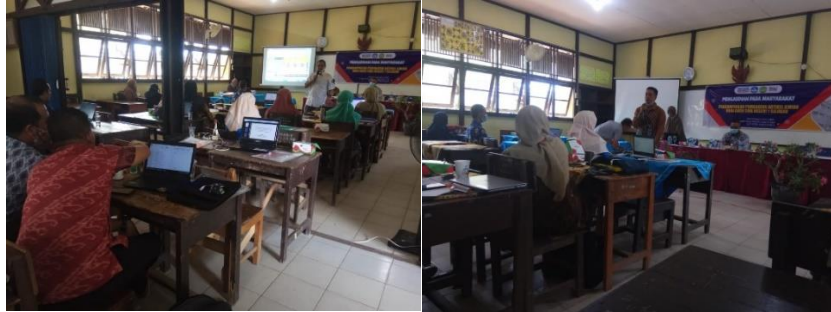
Gambar 1. Pemaparan Materi Oleh Narasumber

Beberapa pertanyaan yang muncul pada tahap pertama ini adalah terkait dengan plagiarisme, metode penelitian, dan cara menggunakan reference manager . Secara umum peserta mengikuti dengan baik tahap pertama ini. Dokumentasi pada tahap pertama dapat dilihat pada Gambar 1 .