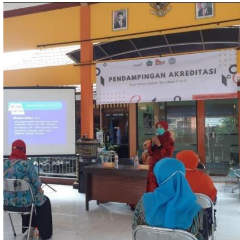
Gambar 1. Kegiatan Seminar Akreditasi

Kegiatan seminar akreditasi dilakukan pada tanggal 7 Februari 2022 mulai jam 9.00 s.d 12.00 WIB di balai desa Banjar Bendo seperti ditunjukkan pada Gambar 1 . Kegiatan ini dihadiri oleh pendidik dan Kepala Lembaga Pos PAUD Al-Hayyu serta mengundang pendidik dari Pos PAUD di desa sekitarnya, dengan jumlah kurang lebih 15 peserta. Narasumber kegiatan ialah dosen Pendidikan Guru PAUD, UMSIDA dan sebagai praktisi di BAN PAUD dan PNF Jawa Timur. Kegiatan ini meliputi: pembukaan, penyampaian materi tips sukses dalam persiapan akreditasi PAUD, diskusi dan tanya jawab, serta penutup.