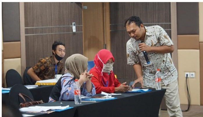
Gambar 2. Workshop member komunitas pemuda penggerak pembangunan desa

Komunitas sebagai salah satu aktor dalam kolaborasi penta helix memiliki peran yang sangat penting sebagai akselerator. Dalam hal ini komunitas merupakan sekumpulan orang yang memiliki minat yang sama dan relevan dengan visi yang sedang dikembangkan. Generasi muda dengan potensi, minat dan passionnya penting diwadahi serta diberdayakan melalui sebuah komunitas, sehingga mereka dapat membuat sebuah