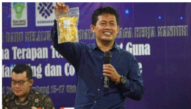
Gambar 4. Pelatihan Wirausaha Terapan dengan Narasumber dari Akademisi dan Praktisi Usaha Kecil dan Menengah Kabupaten Jombang

Sektor swasta merupakan entitas yang melakukan proses bisnis dalam menciptakan nilai tambah dan mempertahankan pertumbuhan yang berkelanjutan. Tidak hanya itu, sektor swasta juga diperlukan dalam memberikan perhatian pada proses pembangunan melalui corporate social responsibility yang dimilikinya. Komunitas pun bisa menjadi jembatan penghubung antara berbagai aktor dengan swasta dalam dukungannya pada proses pembangunan di desa. Pada program pemberdayaan ini, tim pengabdian masyarakat mendorong untuk melakukan pelatihan digital marketing, melalui pelatihan wirausaha terapan dengan narasumber dari akademisi seperti Gambar 4 .