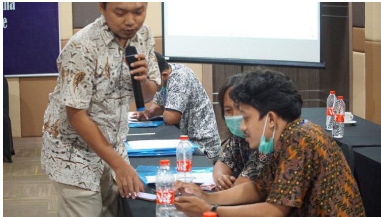
Gambar 3. Pelatihan digital marketing menggandeng praktisi bisnis

gerakan bersama sesuai dengan visi yang diusungnya. Dalam hal pembangunan desa, komunitas yang didalamnya generasi muda dapat bertindak sebagai perantara maupun penghubung antar stakeholder (aktor) dalam konsep kolaborasi pentahelix. Komunitas dapat berkolaborasi dengan pemerintah sebagai regulator sekaligus berperan sebagai kontroler yang memiliki peraturan dan tanggung jawab dalam proses pembangunan. Selain itu, untuk memaksimalkan kolaborasi pentahelix dalam pembangunan desa perlu juga menguatkan peran sektor swasta, akademisi dan media. Keberadaan sektor swasta dalam kolaborasi ini menjadi penting sebagai enabler . Adapun pelatihan digital marketing ditunjukkan pada Gambar 3 .